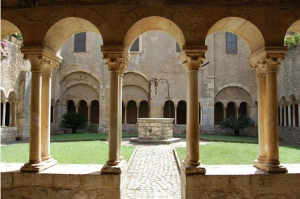
Il bellissimo chiostro da cui si accede a tutti i locali intorno, le dipendenze abbaziali